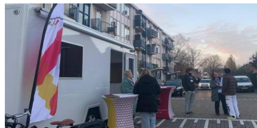
Medewerkers WaWo in gesprek in Snaayerbuurt

In 2025 zijn belangrijke stappen gezet. In de wijken Zuidbuurt en MUWI wordt een deel van de woningen gesloopt en een deel van de woningen gerenoveerd. De woningen in de Snaayerbuurt worden gesloopt. Per 1 maart 2026 krijgen deze bewoners urgentie.