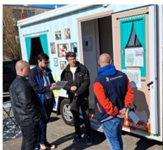
Bewoners kunnen in gesprek met medewerkers WaWo

In 2025 zijn belangrijke stappen gezet. In de wijken Zuidbuurt en MUWI wordt een deel van de woningen gesloopt en een deel van de woningen gerenoveerd. De woningen in de Snaayerbuurt worden gesloopt. Per 1 maart 2026 krijgen deze bewoners urgentie.