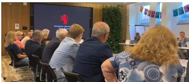
Raadscommissievergadering over Snaayerbuurt

Al jarenlang vroeg de Huurdersraad om bewoners zekerheid te geven over wat er met hun woningen zou gebeuren. In het geval van de Snaayerbuurt gaven we al jaren aan dat de woningen van slechte kwaliteit zijn.