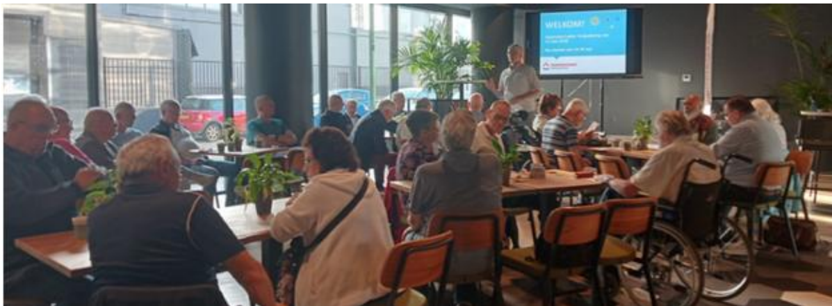
Impressie van de ALV

We besloten dit jaar geen tweede ALV te houden, maar eerst binnen het bestuur verder te gaan met onze interne organisatie en overeenstemming te krijgen met Waterweg Wonen over onderwerpen voor de jaarplanning 2026. Op basis daarvan zouden we het ons eigen werkplan 2026 opstellen. Om verschillende redenen is er met Waterweg Wonen nog geen overleg geweest over de jaarplanning 2026.