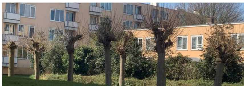
Een deel van de wijk MUWI