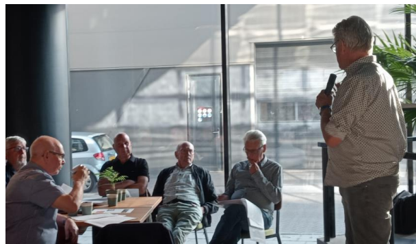
Impressie van de ALV van 13 mei 2025