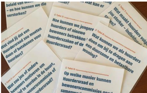
Vragen tijdens de ALV